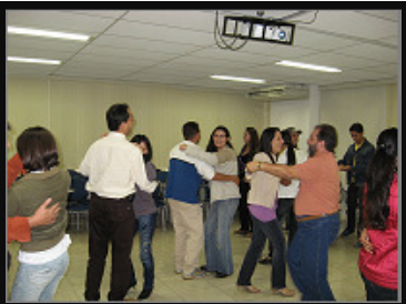
Equipe Gerencial COPASA I