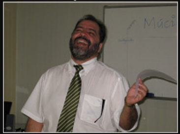
FACULDADE IBHES | Liderança