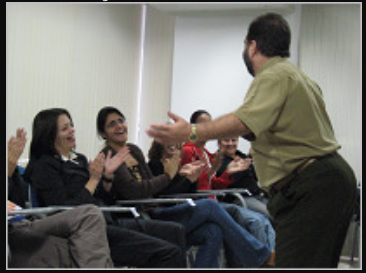
LIDERANÇA TMK | 06/2009