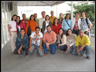
LIDERANÇA 3º SETOR | Belém

Múcio Morais Soluções Empresariais Ltda.