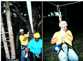
Liderança Eficaz com atividades de ECOTRAINING – CONTATO/2009

São mais de 150 TEMAS voltados para o desenvolvimento pessoal e profissional, aplicados à equipes e empresas em diversas regiões do Brasil!