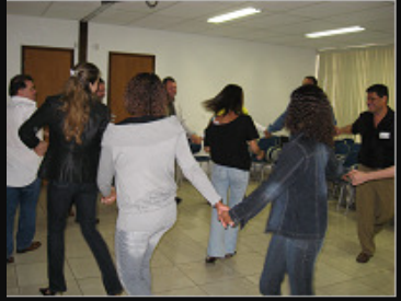
Equipe Gerencial COPASA DVRC I