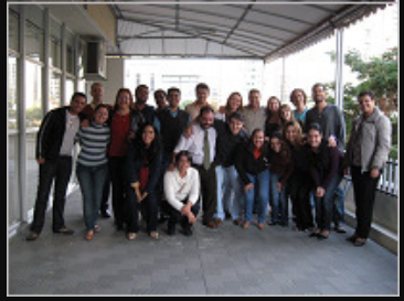
Liderança UNIFENAS | 07/2009