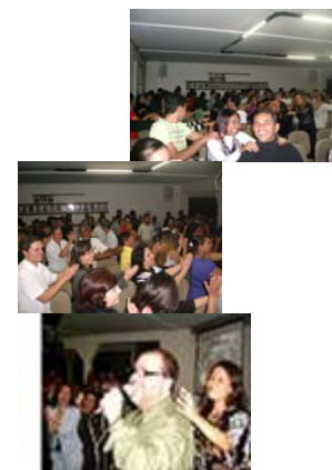
Patrocínio: Caixa Econômica Federal, Federaminas, Sebrae, Vale e Associação Comercial e Industrial e Itabira – ACITA..

profissão em diversos Estados do Brasil, participando de grupos de discussão, seminários e cursos de atualização.