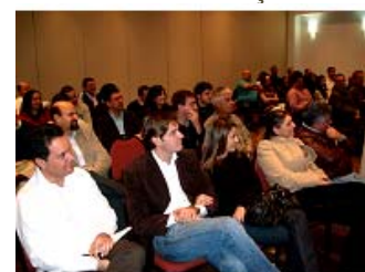
Palestra Motivacional para executivos e vendedores do Grupo Melo Cordeiro, São Paulo – SP

profissão em diversos Estados do Brasil, participando de grupos de discussão, seminários e cursos de atualização.