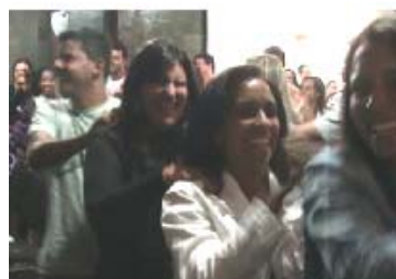
AO MESTRE COM CARINHO – Palestra Faculdade IBES – Salvador-BA.