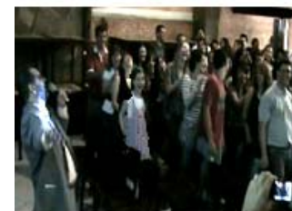
Palestra Motivacional para funcionários do Grupo Pharmativa, Conselheiro Lafaiete – MG

FAP(Teresina), UNIJIPA, UNIRON – GESTÃO DE CARREIRA PARA UNIVERSITÁRIO, ASSOCIAÇÃO MÉDICA DE MINAS GERAIS – 1º EVENTO EMPRESARIAL DO CENTRO DE CONVEÇÕES DA AMMG, Liderança, Motivação e Inteligência Emocional, DEMAG CRANES – SERVICE DAY CONGRESSO,