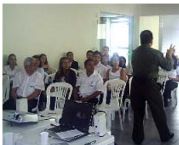
Novas tecnologias em vendas, Curso de vendas e atendimento, Grupo Móvil Alormov, Belo Horizonte - MG