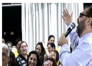
Educadores de Sucesso | Liderando transformações - palestra no CES – Centro de Ensino Superior, Conselheiro Lafaiete – MG

Educar é o único meio para despertar consciência, cidadania e motivação para vencer. A ignorância é o subproduto da corrupção e do egoísmo.