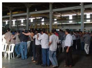
Ambiente, pessoas e resultados, palestra de Clima Organizacional, LCA Cabos, Vitória - ES.