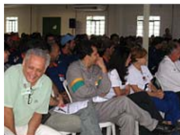
PETROBRAS – Palestra SIPAT na Refinaria Gabriel Passos. Betim - MG