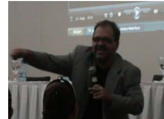
Palestra Motivacional para equipe da Junta Comercial do estado de Minas Gerais – JUCEMG.