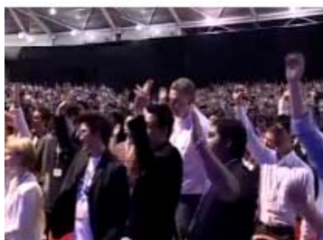
Espiritualidade nas Empresas, Palestra no VI Encontro de Empreendedores, Salvador – BA