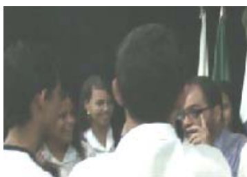
Líderes do Futuro, Palestra na Fundação CDL, Belo Horizonte – MG